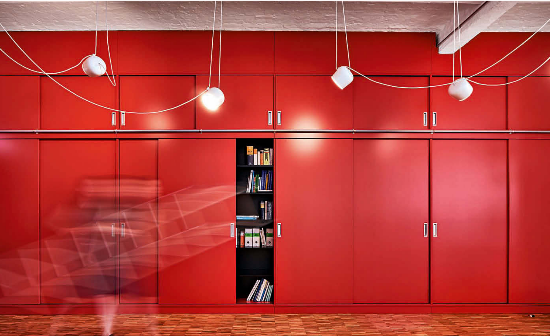
Das Großraumbüro spannt sich zwischen einem roten Wandschrank und einer roten Sitzlandschaft auf. • The open-plan office stretches between a red cabinet and a red seating area.

ARCHITEKTURBÜRO IN BERLIN VON HDR UND DEN LICHTPLANERN ENVUE HOMBURG LICHT