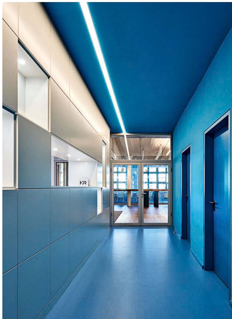
Der Eingangsbereich ist in der CI-Farbe Blau gestaltet. • The entrance area is designed in the CI colour blue.

themen: Die Beleuchtung der Arbeitsplätze mit einer technisch-architektonischen Lichtlösung und die eher dekorative Beleuchtung der Aufenthalts- und Pausenräume.