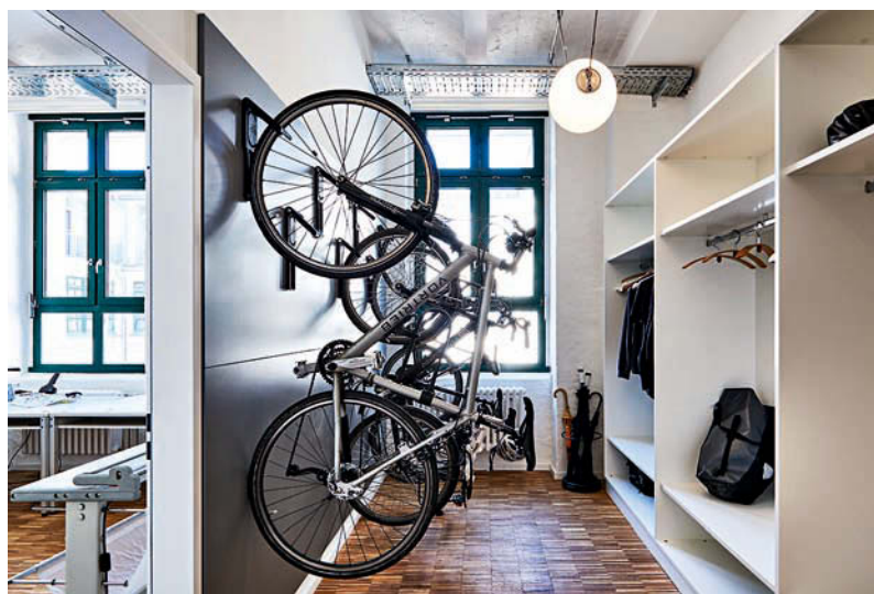
Bei der Planung wurde an alles gedacht. • Everything was taken into account in the planning process.